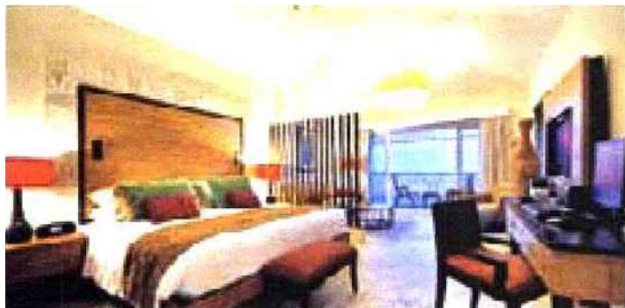
Club Med de Punta Cana, en République dominicaine.