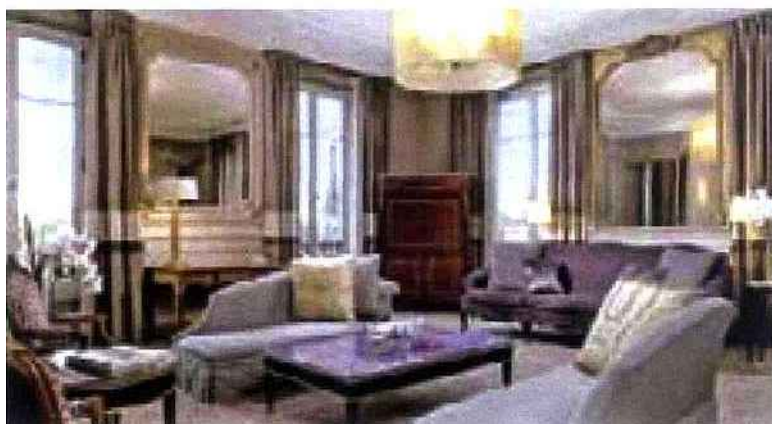
L'hôtel Westin, a Paris.

Une soudaine envie de partir ? Il reste des places un peu partout et même des bonnes affaires, à condition de modérer ses exigences et de saisir les opportunités qui passent.