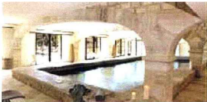
Les Jardins de Saint-Benoît sont situés au cœur des vignobles de l'Aude.

Embarquement sur une paisible rivière ou un canal. En Bourgogne, Bretagne, Franche-Comté, Alsace ainsi que sur le canal du Midi pour une semaine en juillet. Le bateau peut accueillir jusqu'à huit passagers. C'est donc idéal pour